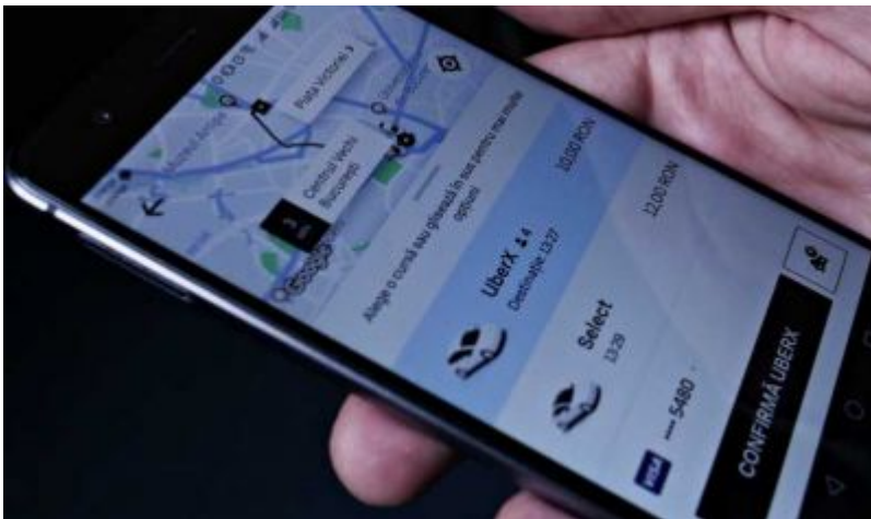
uber lege reglementeaza ridesharing soferi cont blocat startupcafe.jpg

Veniturile Uber pentru cel de al treilea trimestru din acest an au fost de 3,8 miliarde de dolari, peste asteptari. Dar pierderile au fost de 1,1 miliarde de dolari, cu 18% mai mari fata de aceeași perioadă a anului trecut, ceea ce a dus la o scădere drastică a pretului acțiunilor, problema majoră a companiei, în ultimele luni, scrie startupcafe.ro .